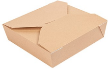
Caixa Cartolina Kraft 2910ml THEPACK 21,7x21,7x6cm (50un)