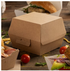
Caixa Hambúrguer THEPACK 14,4x13,6x9,2cm Natural (50un)