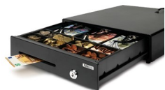
Gaveta Dinheiro SAFESCAN 3N/ 8M LD-3336 (RJ12)