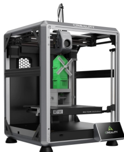
Impressora 3D Fechada CREALITY K1 SE Volume 22x22x25cm USB, Wi-Fi